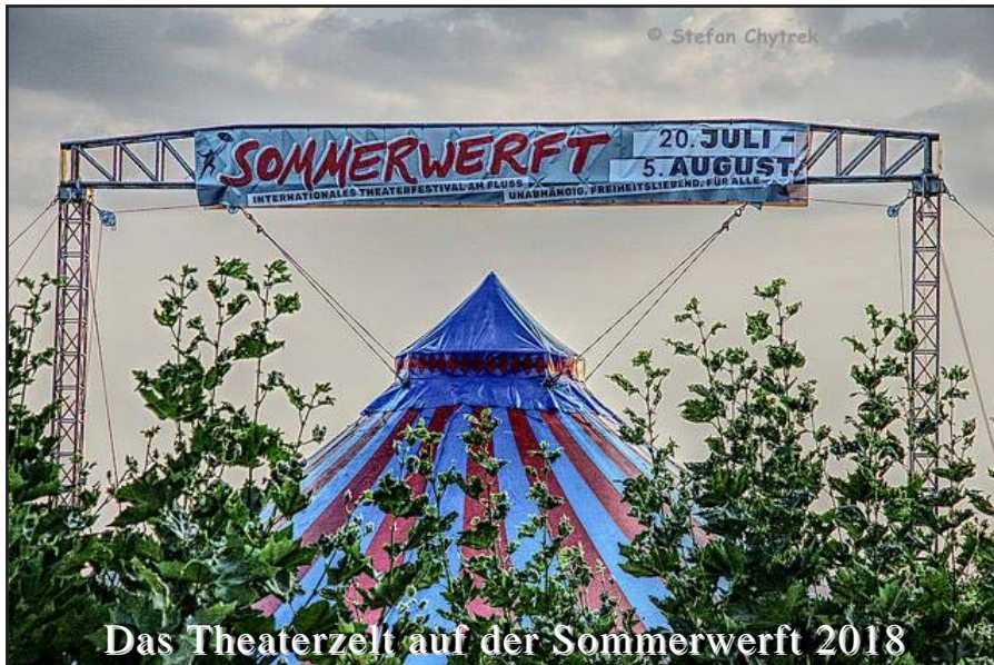
Das Theaterzelt auf der Sommerwerft 2018

len Musikszene verschiedene Konzertplattformen anzubieten. Deshalb war es auch im vergangenen Jahr wichtig, das Programm der Akustikbühne zu gestalten. Da sich die Live-Situation in den letzten Jahren stark verändert hat, haben viele Musiker/innen und Bands begonnen, ihre Musik auch unplugged, ohne eGitarre und Schlagzeug zu präsentieren. Da bieten sich neue Möglichkeiten Konzerte zu geben – Wohnzimmer Konzerte, Konzerte in Restaurants oder kleinen Baars, Konzerte in kleinen Kneipen. Das geht nur wenn man bereit ist die Lautstärke der eigenen Musik drastisch zu reduzieren und seine Musik auch vor einem kleinen Publikum zu performen. Die Bühne im Beduinenzelt bietet VirusMusik die Chance das reichhaltige Universum der akustischen Musik zu erforschen. Neue Musiker/innen und Bands kennen zu lernen und auf der anderen Seite bietet die Bühne Musiker/innen, die ihre Musik mit viele Phone präsentieren, Möglichkeiten in intimer Atmosphäre neue Erfahrung zu machen. Die Konzerte im Beduinenzelt haben mittlerweile einen sehr guten Ruf und das weit über die Region hinaus. Auf der Sommerwerft 2018 gaben 56 Bands aus unterschiedlichen Musikrichtungen wunderbare Konzerte und sorgten beim Publikum für viele magische Momente. Die Kosten für die Technik, Logistik, Gagen, etc. werden von Protagon, den Veranstaltern der Sommerwerft getragen. VirusMusik trägt lediglich die Bürokosten, die mit dem Organisieren des Programms verbunden sind.