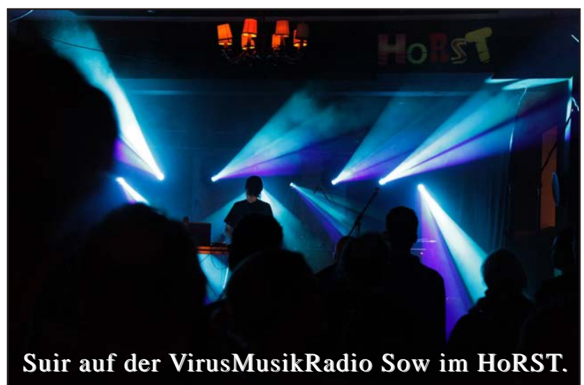
Suir auf der VirusMusikRadio Sow im HoRST.