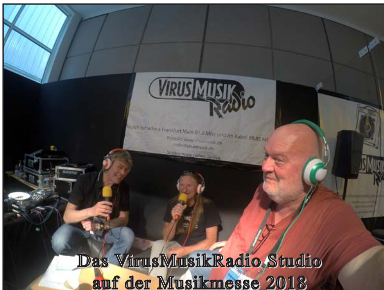
Das VirusMusikRadio Studio auf der Musikmesse 2018

Auf der Musikmesse in Frankfurt laufen nicht nur Instrumentenhersteller oder Musikfachhändler herum. Die Musikmesse bringt professionelle Akteure der Musikinstrumentenbranche mit Musiker/innen aus aller Welt zusammen.