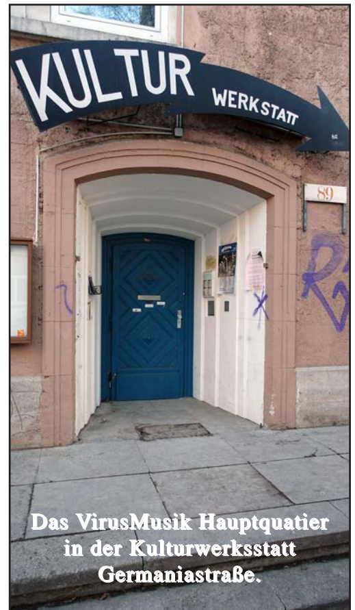
Das VirusMusik Hauptquartier in der Kulturwerkstatt Germaniastraße.

Das VirusMusikBüro arbeitet eng mit den Musikbunkervereinen und anderen Kulturvereinen der Stadt Frankfurt zusammen. Die Büro-Crew hilft Musiker/innen und Bands bei der Suche nach günstigen Probenräumen, unterstützt bei der Kontaktaufnahme mit Veranstalter, bietet Hilfe bei Aufnahmen von Demos an und hat Antworten auf viele Fragen zum Musikbusiness. Auch 2018 konnten wir viele Bands an regionale Veranstalter weiter vermitteln. VirusMusik sorgt dafür, dass die Tonträger guter Bands aus der Region in den täglichen VirusMusikRadio-Sendungen gespielt werden.