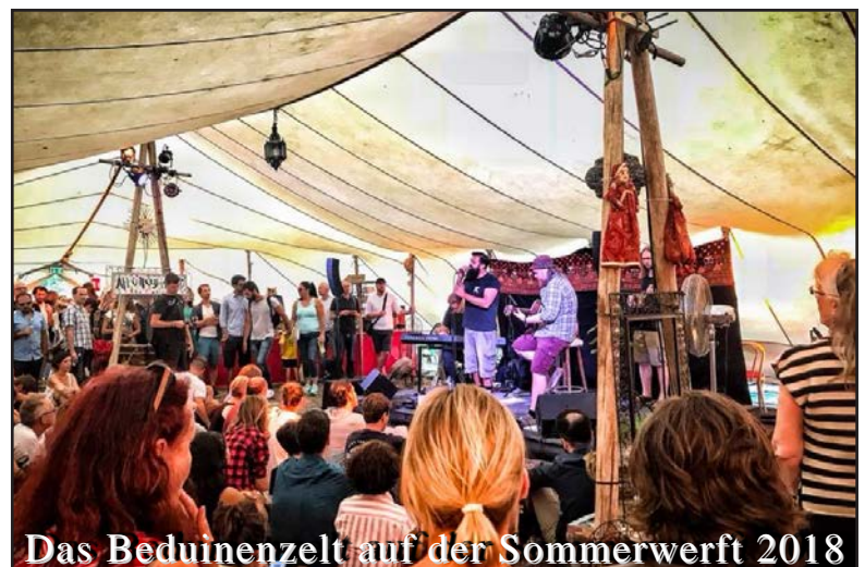
Das Beduinenzelt auf der Sommerwerft 2018

Nach sechs Jahren kam vor drei Jahren bei VirusMusik das Thema Sommerwerft zurück. Die Singer & Songwriter, oder Unplugged-Bühne im Beduinenzelt wurde viele Jahre (10) von VirusMusik organisiert und entwickelte sich zu einer der beliebtesten Akustik-Bühnen der Region. Im Jahr 2016 hat VirusMusik nur die Moderation des Festivals übernommen, 2017, also vor zwei Jahren lag die Programmplanung und Organisation des Beduinenzeltes auf der Sommerwerft wieder komplett in den Händen von VirusMusik. VirusMusik hat immer schon daran gearbeitet der regionalen