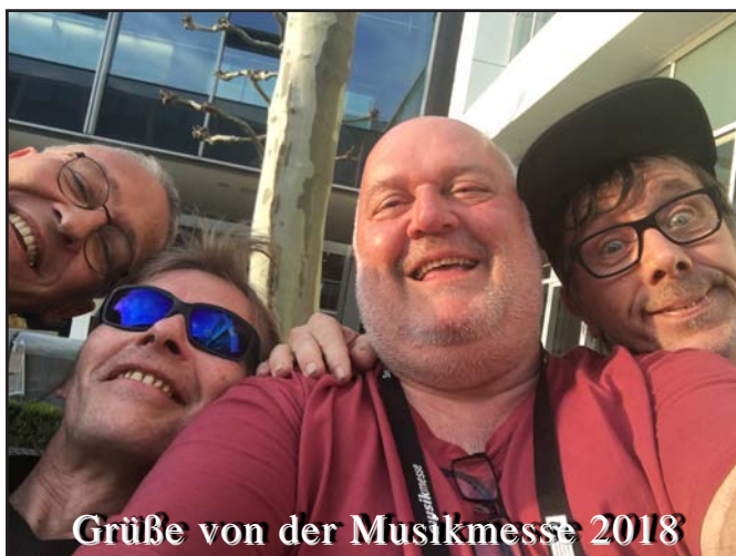
Grüße von der Musikmesse 2018

VirusMusik brachtet auf der Internationalen Musikmesse regionale Musiker/innen und Bands mit Menschen aus dem Musikbusiness zusammen, damit das musikalische und das kulturelle Potential der Region