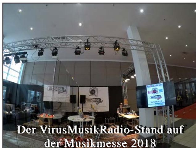
Der VirusMusikRadio-Stand auf der Musikmesse 2018

Es gab wie in den Jahren zuvor noch ein zweites Studio, wo Interviews mit Menschen aus der Musikbranche, Gespräche mit Musiker/innen und Bands, Ausschnitte aus den Live-Konzerte vom Musikmesse Festival und natürlich viel Musik von der regionalen Musikszene, für die Nachtschleifen-Sendungen aufgezeichnet wurde. Die auf der Musi9kmesse produzierten Nachtschleifensendungen wurden in zwei Nächten am Musikmesse-Wochenende