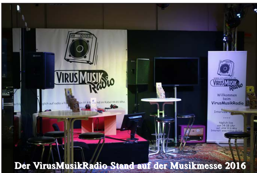
Der VirusMusikRadio Stand auf der Musikmesse 2016

2016 fand zum ersten Mal parallel zu Musikmesse, dass Musikmesse Festival statt. Dieses Festival ist ein Rock, Pop, Indie, Electronic und Jazz Festival, das vom 07.04.2016