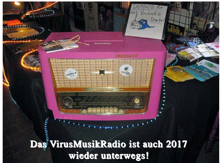
Das VirusMusikRadio ist auch 2017 wieder unterwegs!

Im Musikbüro trifft sich auch monatlich die VirusMusikRadio Redaktion. Bei diesen Treffen werden sowohl die bevorstehenden Events wie auch die laufenden Radiosendungen besprochen. Die VirusMusikRadio Redaktion arbeitet ehrenamtlich. Da laufen die Dinge nicht so glatt, als wenn eine bezahlte Crew zusammenarbeitet, aber jeder bzw. jede in der VirusMusikRadio Redaktion brennt für die regionale Musikszene, alle geben ihr Möglichstes, um die täglichen Radiosendungen zu stemmen. Wenn jemand mal keine Zeit hat, oder etwas ganz plötzlich dazwischenkommt, dann wird eine Mail in die Redaktion geschickt (ins VirusMusik Büro) und schon findet sich jemand der einspringt. Gerade für Events, die mehrere Tage dauern, wie die radio x Bühne, oder die Live-Übertragung von der Musikmesse, ist es schwer