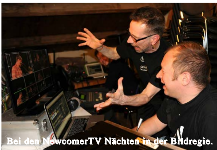
Bei den NewcomerTV Nächten in der Bildregie.

Fernsehaufnahmen für die eigene Promo. Die Magazinsendung wird wöchentlich auf Rhein-Main-TV ausgestrahlt und die Konzertaufnahmen sind auf der NewcomerTV Seite zu sehen. Die Sehgewohnheiten der jungen Konzertbesucher/innen verändert und der Trend geht zu Internetfernsehen. Deshalb arbeitet NewcomerTV und VirusMusik an einen gemeinsamen YouTube-Kanal. Aber das ist noch etwas Zukunftsmusik. Für die an den Veranstaltungen teilnehmenden Musiker/innen und Bands sind die Videomitschnitte, die sie bekommen können, so zu bewerten wie eine Gage. Videomitschnitte von Live-Konzerten werden für Musiker/innen