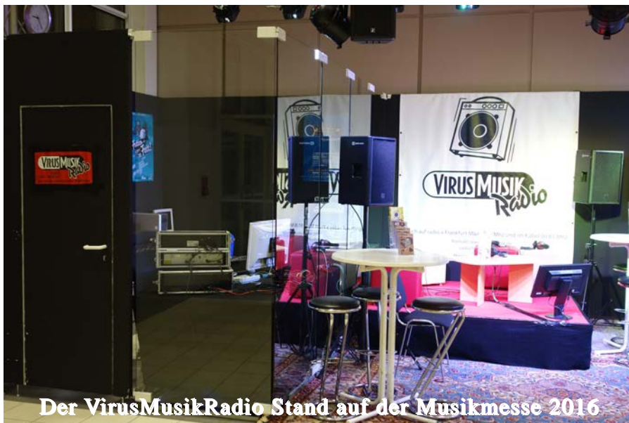
Der VirusMusikRadio Stand auf der Musikmesse 2016

bis 09.04.2016 in Frankfurt am Main (DE) stattgefunden hat. Die Top-Acts waren Al Jarreau, Axwell, In-grosso und Roger Cicero, aber auch viele regionale Bands waren auf dem Festival zu sehen und zu hören. Die VirusMusikRadio Redaktion stellte die Veranstalter des Festivals vor, berichtete von den einzelnen Konzerten, stellte die Musiker/innen und Bands des Festivalprogrammes vor und fragte das Publikum nach den Konzerten noch ihrer Meinung. Die Vorbereitungszeit für das Live-Radio von der Musikmesse beträgt zwei bis drei Monate. Die Planung