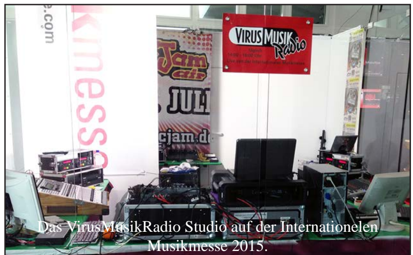
Das VirusMusikRadio Studio auf der Internationalen Musikmesse 2015.

VirusMusik Germaniastrasse 89, 60389 Frankfurt 069-945 900 17 - Fax 069-945 900 19 eMail: radio@virusmusik.de - Web: www.virusmusik.de