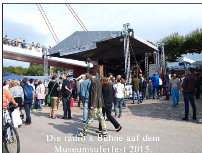
Die radio x Bühne auf dem Museumsuferfest 2015.

Die Organisation der radio x Bühne auf dem Museumsuferfest musste im letzten Jahr auch auf neue Füße gestellt werden. VirusMusik übernahm die Gesamtorganisation und suchte sich einen neuen Partner, der die Getränke verkaufte. Über den Getränkeverkauf kamen 2000 Euro, zur Tilgung der Gesamtkosten. Zum ersten Mal konnte der „Offene Kanal Offenbach“ (MOK) zu einer Zusammenarbeit gewonnen werden. Er zeichnete das Bühnenprogramm mit sechs Kameras auf und die Musikfans konnten sich die Konzerte der Bands, zeitversetzt im Internet anschauen.