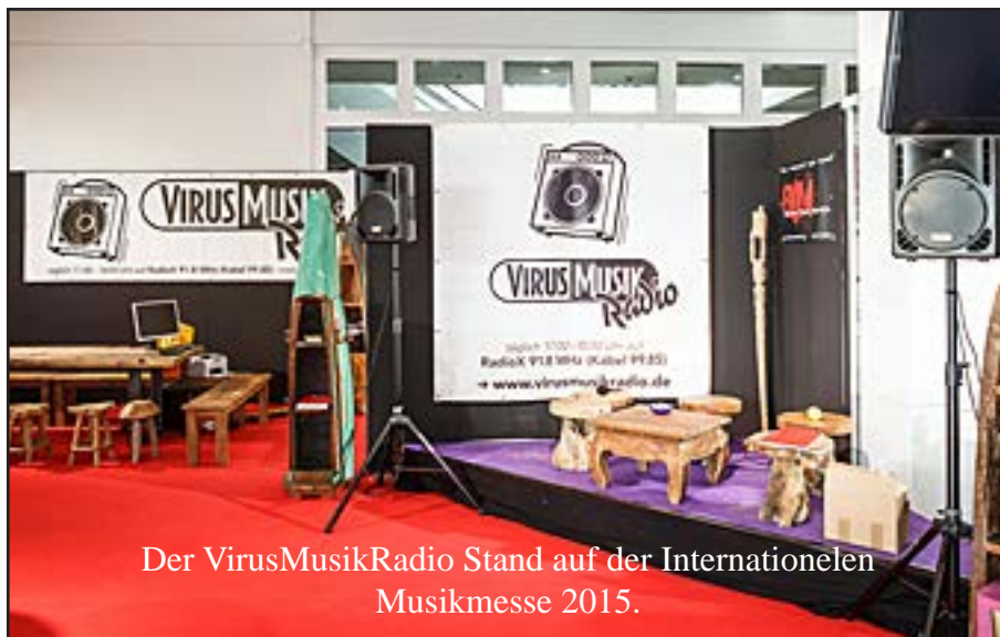
Der VirusMusikRadio Stand auf der Internationalen Musikmesse 2015.

In der VirusMusikRadio Redaktion arbeiten ca. zwanzig Mitarbeiter/innen ehrenamtlich in fünfzehn Redaktionen zusammen, um das Stattfinden der täglichen Sendung zu gewährleisten. Die einzelnen Redakteure/innen sind für den Inhalt ihrer Sendungen selbst verantwortlich. Sie müssen an Rechts- und Technikseminaren teilnehmen, denn die gesetzlichen Bestimmungen im Radiorecht sind kompliziert. In einem nicht kommerziellen Lokal-Radio wie radio x bzw. VirusMusikRadio besonders kompliziert. Neben den täglichen Sendungen organisierte die VirusMusikRadio Redaktion auch die Live-Radio Events von VirusMusik. VirusMusik arbeitete bei seinen Live-Radio-Events aber auch mit Redakteuren/innen anderer hessischen NKLs zusammen.