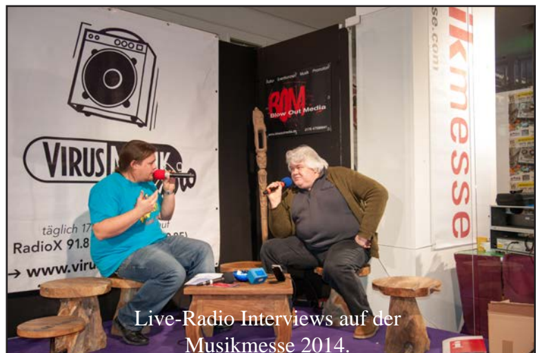
Live-Radio Interviews auf der Musikmesse 2014.

Das VirusMusikRadio Konzept für den Musikmesseauftritt, wie auch die redaktionellen Themen bedurfte monatelanger Vorbereitungen. Die VirusMusikRadio Redaktion hat seit Ende vergangenen Jahres zu Vorbereitungsgesprächen im VirusMusik Büro getroffen, um gemeinsam das Konzept auszuarbeiten und die Inhalte vorzubereiten.