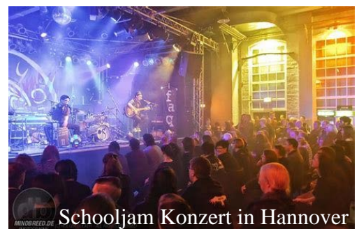
Schooljam Konzert in Hannover